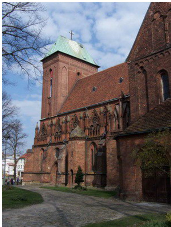
Najlepszy widok na katedrę

Na wstępie jako ciekawostkę dotyczącą prehistorii Kamienia można podać, że pierwsza wzmianka o osadnictwie na tym terenie pochodzi z antycznej mapy z lat 142–147 n.e. Jej autor – Ptolemeusz w okolicach dzisiejszego miasta zaznaczył miejscowość o nazwie Rugiom. W kolejnych wiekach był to gród i port należący do zachodniosłowiańskiego plemienia Wolinian. Lud ten długo się opierał najazdom Mieszka I i jego następców, a także Duńczykom. Ostatecznie w latach 20. XII stulecia Wolin zajęły wojska Bolesława Krzywoustego.