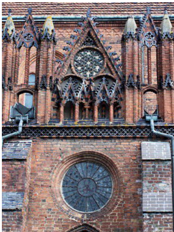
XV-wieczne dekoracyjne szczyty nawy bocznej

Mniej więcej w tym samym czasie Oton z Bambergu , na prośbę Krzywoustego, podjął misję chrystianizacyjną zakończoną chrztem Wolinian. W 1140 roku papież Innocenty II utworzył nową diecezję obejmującą Pomorze Zachodnie z biskupstwem w Wolinie . Pierwszym biskupem został dawny kapelan Bolesława Krzywoustego, Wojciech. W latach 1173, 1177 i 1184 Wolin był trzykrotnie niszczone przez Duńczyków. Ostatecznie zhołdowali oni w 1186 roku całe Pomorze Zachodnie. W XIII wieku obszar ten znalazł się pod zwierzchnością margrabiów brandenburskich, by pod koniec wieku ostatecznie się usamodzielnić.