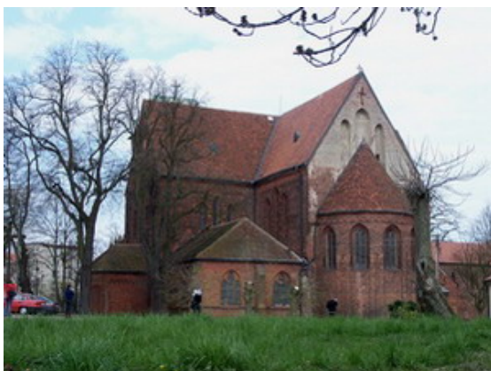
Katedra św. Jana Chrzciciela w Kamieniu Pomorskim

Kamień Pomorski słynie jako uzdrowisko, w którym leczy się schorzenia reumatyczne oraz choroby układu krążenia. Nie jest to jednak jedyny powód, dla którego warto odwiedzić to miasto. Drugi stanowi najstarszy zabytek miasta – katedra św. Jana Chrzciciela, której początki sięgają XII wieku.