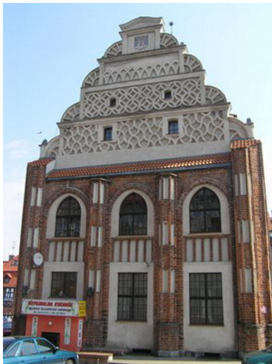
Szczyt zachodni ratusza

mieściła się tu kuria biskupia. Jest to doskonały przykład szczytów renesansowych na Pomorzu z charakterystycznymi przenikającymi się półkolami. Na ścianie zachodniej znajduje się malowniczy XVI-wieczny wykusz, a we wnętrzu jeszcze oryginalna klatka schodowa. W wakacje organizowane są tu wystawy sztuki w ramach Dni Kultury Chrześcijańskiej Ottonia (24.06–1.07.2008). Jak wskazuje nazwa ta cykliczna impreza upamiętnia biskupa Ottona, który ochrzcił mieszkańców Kamienia Pomorskiego.