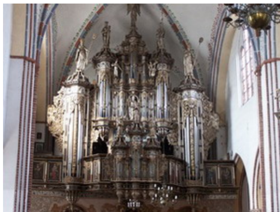
Najpiękniejsze organy barokowe

Nad wschodnim krużgankiem nadbudowano w XIV wieku piętro z czterema salami przeznaczonymi na skryptorium , w którym kanonicy przepisywali księgi. Obecnie jest to Muzeum Katedralne zwane skarbcem, prowadzą do niego strome schody umieszczone wewnątrz muru. Poza ekspozycją prezentującą dzieła sztuki z terenu Pomorza Zachodniego, na ścianach pierwszej sali można dostrzec fragmenty średniowiecznych polichromii z przedstawieniami: Pokłonu Trzech Króli, Zwiastowania, Bożego Narodzenia i Ukrzyżowania. Turystom udostępniane są: jest wirydarz, skarbiec, a także wieża katedralna.