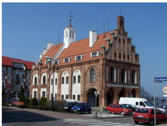
Ratusz podcieniowy na rynku

pieniach prezbiterium (Ogród Edenu), absydy (Ukrzyżowanie), transeptu oraz w kaplicy biskupiej. Ze średniowiecznego wyposażenia zachował się także ołtarz główny przedstawiający Wniebowzięcie Matki Boskiej oraz sceny męczeństwa św. Jana Chrzciciela i św. Faustyny oraz kamienna chrzcielnica. Najcenniejszym dziełem rzeźby był krucyfiks mistyczny, obecnie eksponowany w Muzeum Narodowym w Szczecinie.