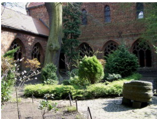
Zacisze katedralne – wirydarz

Wokół katedry stopniowo powstawały też domy kanoników – kanonie, potem również dwór biskupi i dom dziekana, tworząc rodzaj osiedla przykatedralnego, pierwotnie całego ogrodzonego murem.