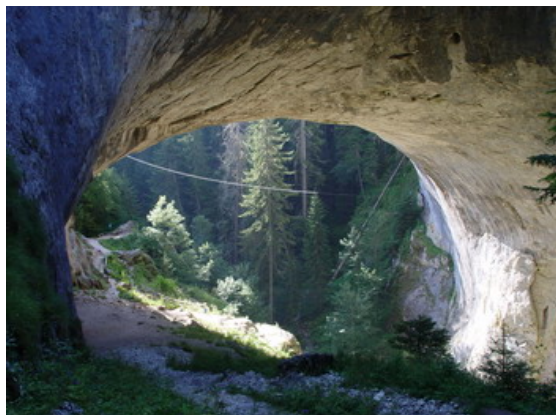
We wnętrzu skalnego mostu

obok znajduje się przepaść głęboka na 43 metry.