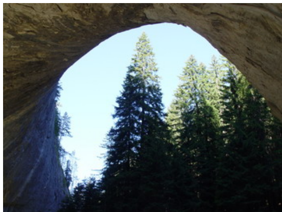
Potężne świerki zdają się być niczym przy potężnej skale

most wyglądał kiedyś podobnie, ale został wydrążony na szerokość.