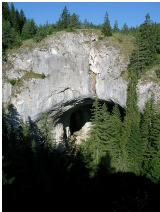
Gigantyczny łuk w Cudnite Mostove

W samym sercu Rodopów – najrozleglejszych, ale rzadko odwiedzanych gór Bułgarii stoją gigantyczne kamienne mosty. To dzieło rzeki Dylbokoto Dere.