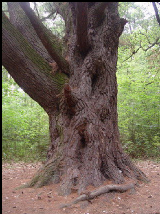
Najstarsza w Polsce sosna wejmutka