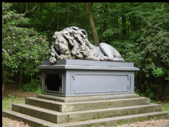
Lew w otoczeniu rododendronów