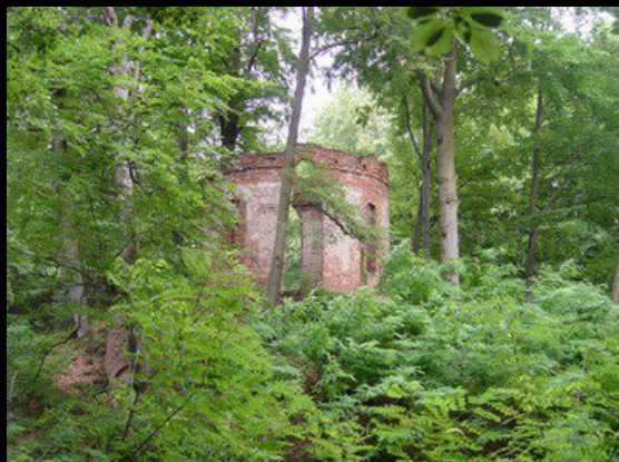
Ruiny świątyni Apollina

Jedna z alej prowadziła do kościoła ewangelickiego zbudowanego w stylu rokokowym w latach 1765–75. Na drugim krańcu powstał znacznie później kościół katolicki. Za pałacem zbudowanym w latach 1752–57 powstał ogród francuski z labiryntami i amfiteatrem. Dość szybko, bo jeszcze w końcu XVIII wieku Heinrich Friedrich Eugen von Württemberg założył za nim park angielski rozpościerający się między dwoma alejami.