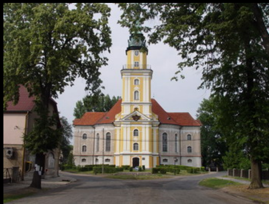
Ewangelicki kościół to perleńka rokokowej architektury

scowość. I tak, za wzór obrano modne wówczas miasto Karlsruhe w Badenii, od którego Pokój przejął także i nazwę używaną do 1945 roku – Karlsruhe.