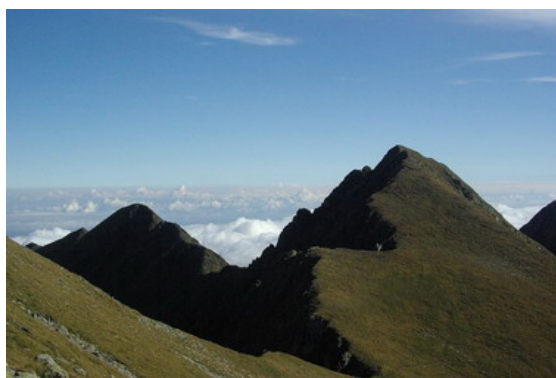
Główny grzbiet Fogaraszy

Z racji dostępności komunikacyjnej, gęstej sieci szlaków turystycznych i licznych schronisk, a przede wszystkim z powodu majestatycznego wysokogórskiego charakteru Góry Fogaraskie są celem licznych wypraw nie tylko rumuńskich turystów. Zachodnia i środkowa część przypomina widoki znane nam z Tatr, zaś część wschodnia ma łagodniejszą rzeźbę, która może przywołać na myśl połoniny ukraińskiego Świdowca.