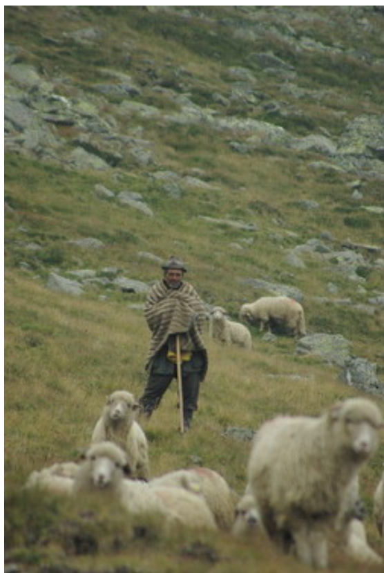
Cioban i jego owce

tów. Stromymi północnymi stokami Fogarasze wyraźnie wyrastają ponad Kotliną Fogaraską, by licznymi grzbietami w miarę łagodnie opaść ku południowi. Tak wyraźne zróżnicowanie rzeźby odzwierciedla się także w szacie roślinnej. Dodatkowo położenie masywu o wiele dalej na południe niż np. Tatr sprawia, że na wysokości, na której u nas występuje górna granica lasu, tutaj dopiero kończy się regiel dolny. Charakterystycznym elementem krajobrazu Fogaraszy są otoczone wysokimi ścianami skalnymi jeziora polodowcowe, których jest około 50.