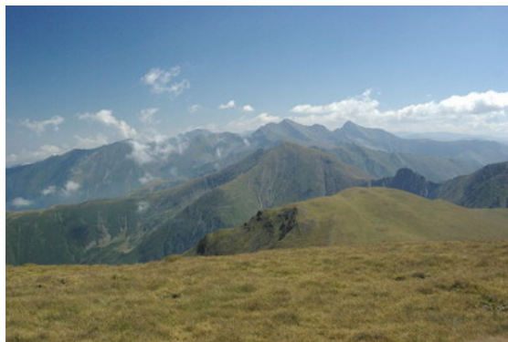
Widok ze szczytu Budislavu

Najpopularniejsza, przynajmniej wśród polskich turystów, trasa trawersu głównym grzbietem Fogarszy łączy miasteczka Tornu Roșu i Victoria. Główny szlak oznakowany jest pionowym czerwonym paskiem, a odcinki dojściowe/zejściowe – odpowiednio czerwonym krzyżykiem (Tornu Roșu) i czerwonym trójkątem (Victoria). Opisaną trasę wiedzie malowniczymi, nieraz mocno eksponowanymi odcinkami głównego grzbietu Fogaraszy. Niektóre fragmenty zostały dla bezpieczeństwa ubezpieczone stalowymi linami.