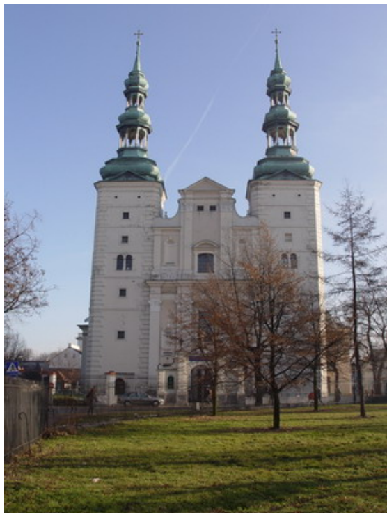
„Collegiata Insignis” – dzieło prześwietne

pozostaje jednak nadal dobitnym przykładem ogromnego talentu tego artysty.