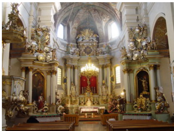
Barokowe wnętrze kościoła pijarów z figurami Plerscha

sad kolumnowych w Polsce. Jej projektantem był prawdopodobnie Karol Antoni Bay.