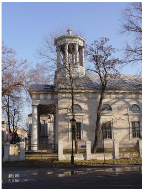
Kościół poewangelicki, dziś galeria „Browarna”