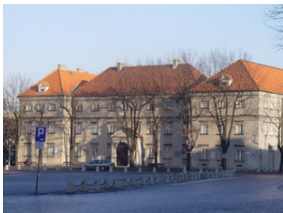
Budynek muzeum w Łowiczu...

Została ukształtowana w taki sposób, że ten, kto na nią patrzy, odczuwa wrażenie falowania owej światłocieniowej powierzchni.