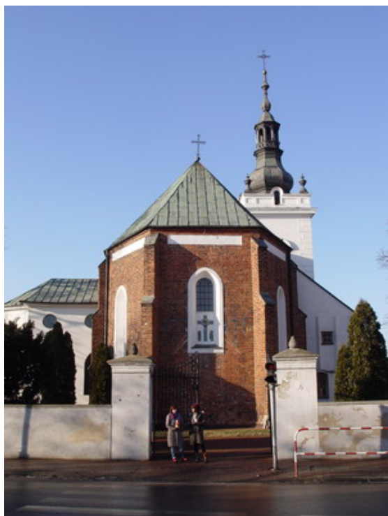
Najstarszy w mieście – kościół św. Ducha

chłopska chałupa z drugiej połowy XVIII wieku oraz tzw. okólnik.