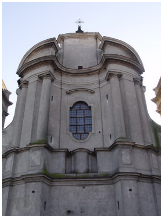
Potęga kolumn w fasadzie kościoła pijarów

i wieczne zbawienie. Niestety wejście do kaplic jest utrudnione – nie są one dostępne dla zwiedzających świątynię. Na szczęście można co nieco zobaczyć przez otwory w żelaznych kratkach.